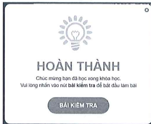
[Hình 7: Hệ thống đưa ra thông báo Học viên đã học xong nội dung Chương Trình Đào Tạo Cơ Bản và yêu cầu thực hiện Bài kiểm tra]