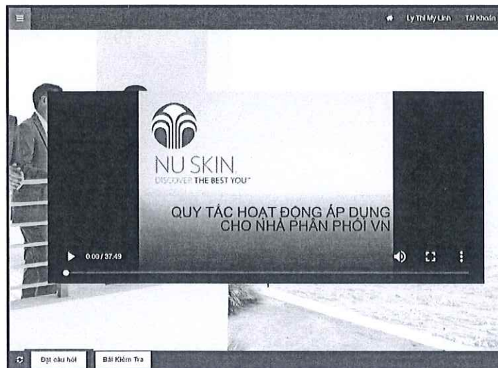
[Hình 2: Cửa sổ “Đặt câu hỏi” luôn được hiển thị trên màn hình để Học viên có thể đặt câu hỏi bất kỳ lúc nào]